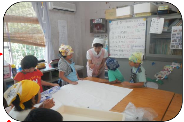
K.先生に作り方の説明を受けています。