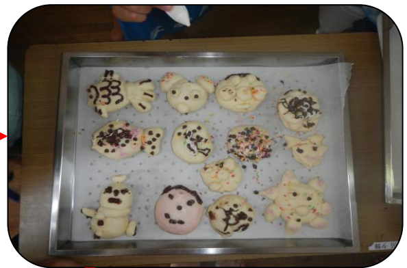
こんなに上手に焼けました♡