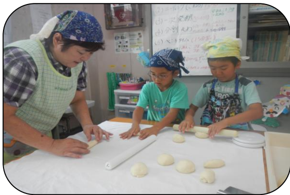
ロールパン作りに挑戦中！！