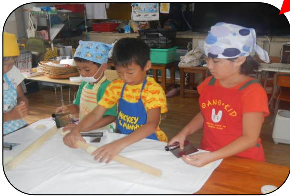
自分たちで好きな形を作っています。