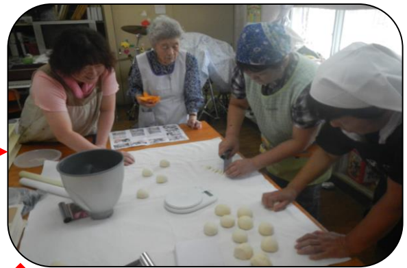
ビハーラの方たちも参加しました☆