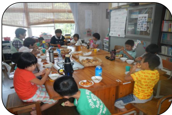
みんなでいただきま～す (*^_^*)